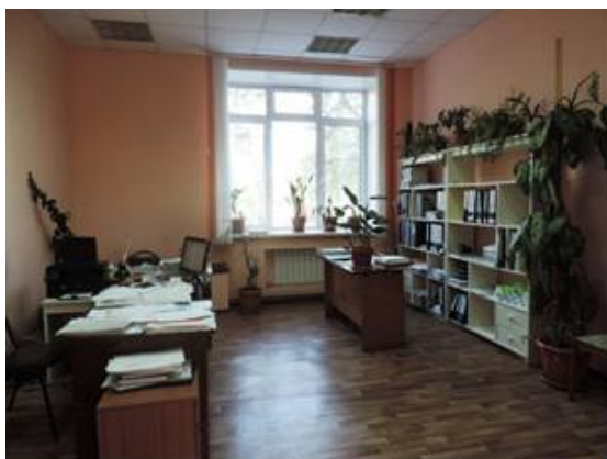
Кабинет приемной комиссии