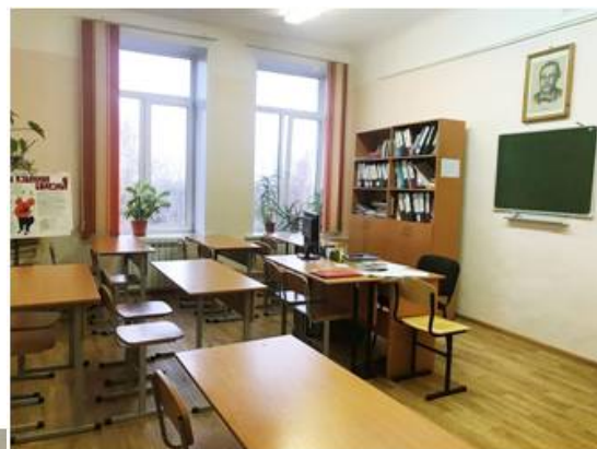
Кабинет лечения пациентов терапевтического профиля