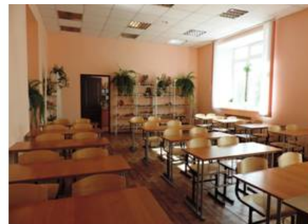
Аудитории для занятий

Учреждение не имеет филиалов и представительств.