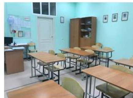
Кабинеты иностранного языка

Учебный процесс обеспечивается 38 учебными кабинетами и аудиториями, в том числе: 2 компьютерными классами, 6