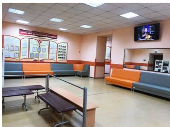
Холл первого этажа учебного корпуса