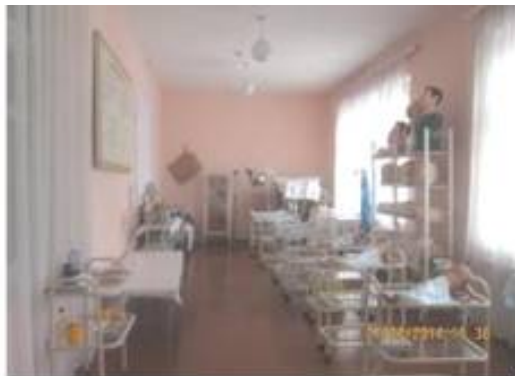
Кабинет обучения манипуляциям

лекционных залов, рассчитанных на 60-90 посадочных мест, 26 -специализированные кабинеты.