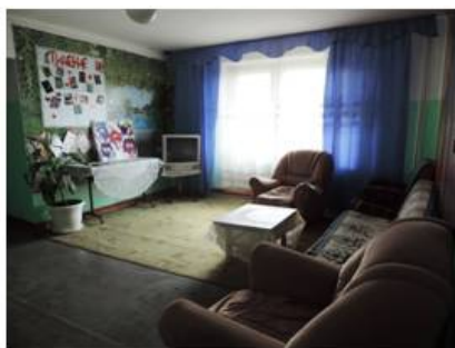
В холлах общежития

В общежитии установлено видеонаблюдение на каждом этаже, видеонаблюдение перед центральной входной дверью. Общежитие находится под круглосуточной охраной, на первом этаже круглосуточно, сменяя друг друга, работают дежурные по общежитию.