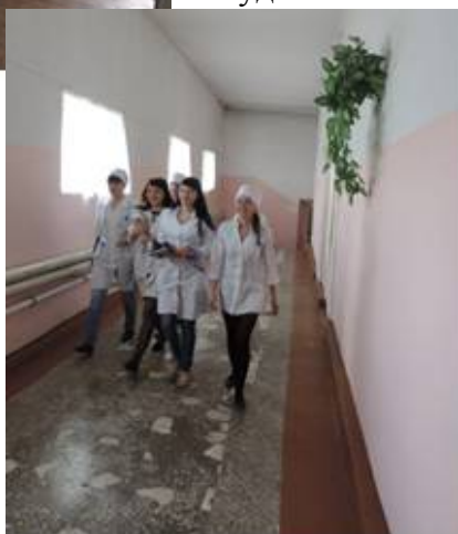
Теплый переход из общежития в учебный корпус

благоприятные условия проживания: удобные кухни с электрическими плитами, 2 умывальные комнаты, 2 туалета на каждом этаже. В общежитии имеется прачечная, оборудованная 4 стиральными машинами-автомат, а также местами для ручной стирки. Имеется сушильная комната, гладильная.